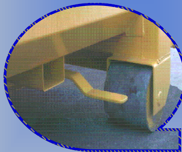
Verrouillage latérale de sécurité