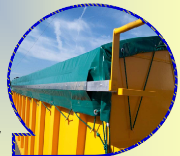
Enroulage par règle alu