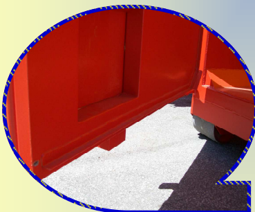
Cornière pour étanchéité